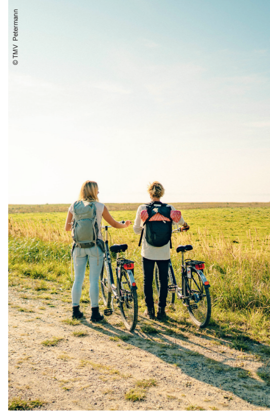
Schweizer lieben Fernradwege: Zu den beliebtesten Fernradwegen Deutschlands zählen der Ostseeradweg und die Radregion Mecklenburgische Seenplatte. 12

Bearbeiten Sie Anregungen oder Beschwerden aufmerksam. 11