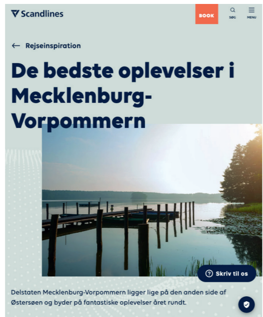
Scandlines bewirbt Tagesausflug per Fähre nach Mecklenburg-Vorpommern. 10